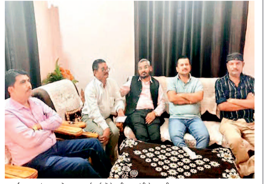
कवर्धा। बृथ क्रमांक 264 में भाजपा कार्यकर्ताओं ने सुनी प्रधानमंत्री के मन की बात।